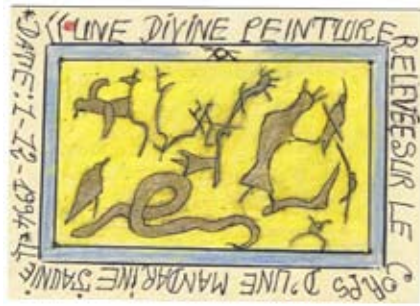
Frédéric Bruly Bouabré, "Une divine écriture relevée sur la peau d'une mandarine jaunie", 1994, dessin sur papier cartonné, 10 x 15 cm. Collection privée.