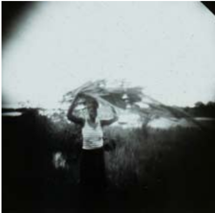
La porteuse- Sténopé