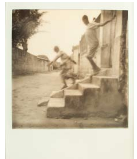
Vie quotidienne - Polaroid