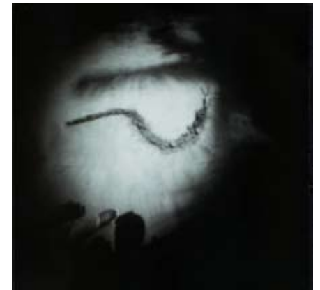
L'esprit du python - Sténopé