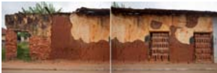
L'évolution architecturale de la ville de Ouidah- numérique