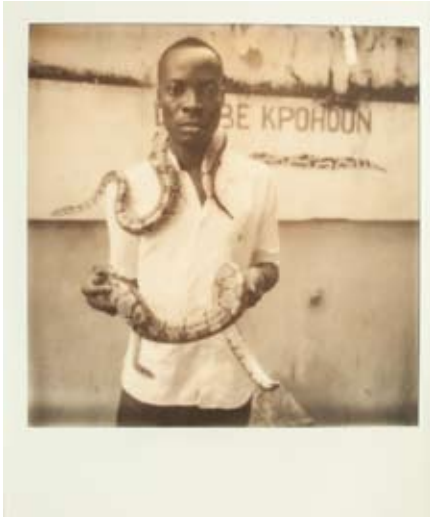
Mémoire vodou- Polaroid