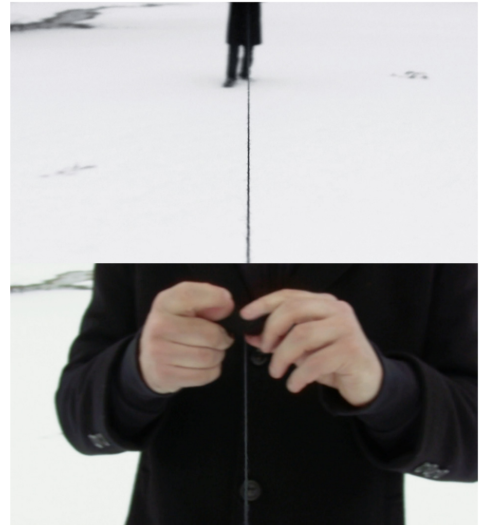
Ismaïl Bahri, Dénouement , 2011, vidéo HD 16/9, 8 min.

Oui, tu as raison. Et finir l'exposition par cette vidéo qui pointe vers son travail s'est fait naturellement. Ça s'est